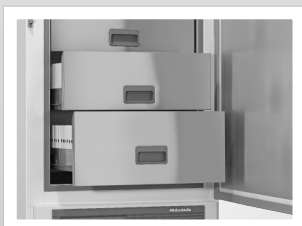
Innenausstattung Edelstahl-Schubfächer mit Kälteblenden.